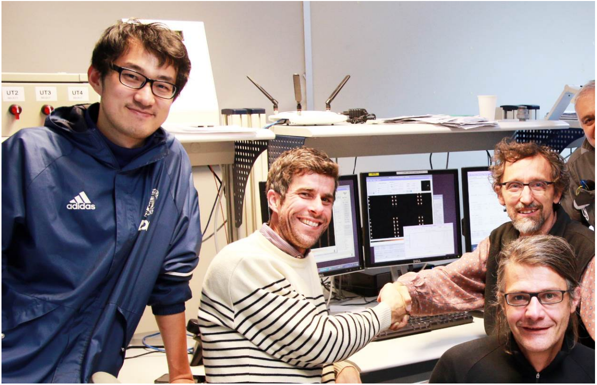
Menlo und ESO Mitarbeiter feiern ‚first light‘ des Astrokamms mit ESPRESSO.